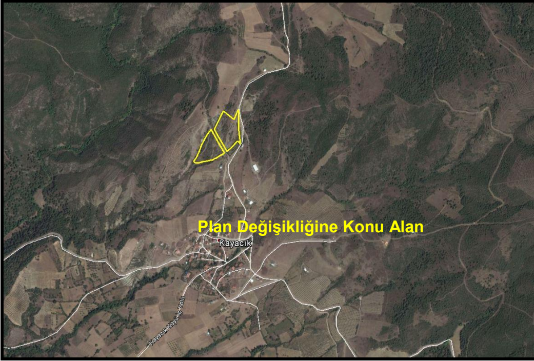
Şekil 1: Plan Değişikliğine Konu Alanın Konumu

Bursa İli, Kestel İlçesi, Kayacık Mahallesi, 142 Ada, 114 ve 117 Nolu Parseller Kayacık Mahallesinin kuzeyinde konumlanmış olup, taşıt yoluna cephelidir.